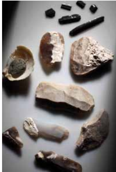
Abb. 4: Neolithisches Werkzeugdepot aus unterschiedlichen Gesteinen und importiertem Obsidian

schaftsstruktur und ihrer materiellen Hinterlassenschaft in ihrem gesamten Spektrum im Fokus der Studien. Zentraler Forschungsansatz ist die Ausgrabung des Tells (Siedlungshügel) in vereinzelt Bereichen, die mit einem breiten und interdisziplinären Spektrum an Analysemethoden verbunden wird, das neben der archäologischen Fundaufnahme auch die Disziplinen der Archäozoologie, Archäobotanik, Geologie und Lagerstättenkunde, Sedimentologie, Geophysik, Metallurgie, Mineralogie sowie Petrografie umfasst. Parallel zu den Ausgrabungen werden Bohrungen mit verschiedenen Fragestellungen, geophysikalische Messungen und unterschiedliche Materialanalysen durchgeführt.