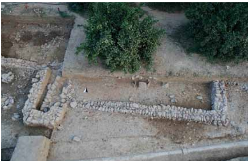
Abb. 3: Neolithischer Baukomplex aus dem 7. Jahrtausend v. Chr., Blick in den Innenraum