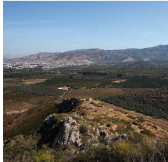
Abb. 2: Blick auf den Çukuriçi Höyük und die umgebende Beckenlandschaft

Die seit 2007 intensiv geführten Forschungen zur ephesischen Urgeschichte vermitteln uns mittlerweile ein neues Bild der Region für die Zeiten vor ihrer antiken Blüte. Die Ausgrabungen des Çukuriçi Höyük brachten Siedlungsreste vom 7. bis zum 3. Jahrtausend v. Chr. zum Vorschein (Abb. 1), mit überraschenden Erkenntnissen und Funden, die weit über die Region hinaus Bedeutung haben.