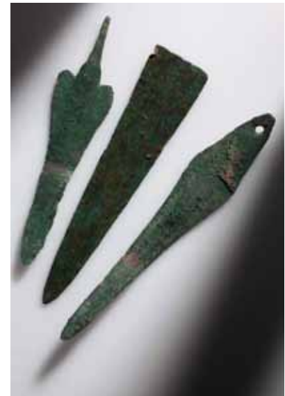
Abb. 5: Verschiedene Dolche der frühen Bronzezeit aus Kupferlegierungen

gen ansässig, die weit über den eigenen Bedarf hinaus Geräte, Werkzeuge, Schmuck und Prestigewaffen produzierte (Abb. 5). Die Verwendung verschiedener Kupferlegierungen steht am Beginn der neuen Epoche der Bronzezeit im frühen 3. Jahrtausend v. Chr. und kann mit zahlreichen zivilisatorischen Innovationen verknüpft werden, die menschliche Gemeinschaften bis heute prägen.