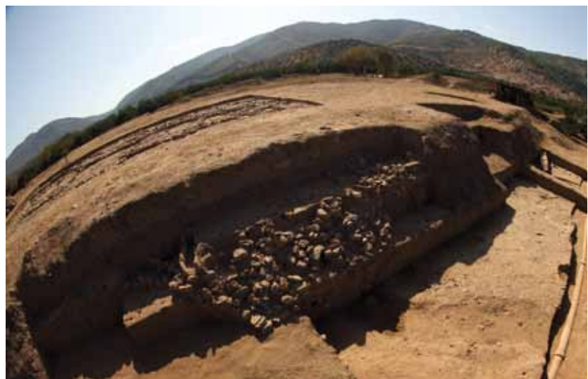
Abb. 1: Der Siedlungshügel Çukuriçi Höyük mit Architekturresten des 7. bis 3. Jahrtausends v. Chr.

Vor dem mikroregionalen Hintergrund stehen Fragestellungen zur Landschaftsentwicklung und Topografie, zu Existenzgrundlagen und Wirtschaftsweisen der Bevölkerung vom Neolithikum bis zum Beginn der Bronzezeit sowie zur Siedlungs- und Gesell-